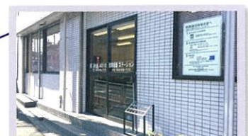
みのりの家訪問看護ステーション