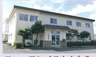
サニープレイスカンナビ