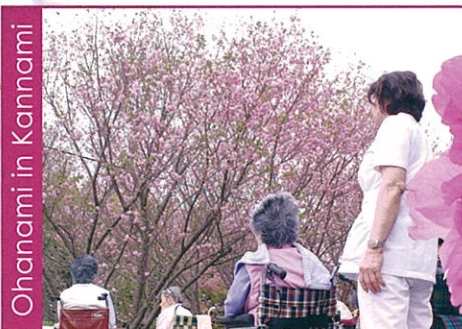
Ohanami in Kannami

函南病院敷地内にある桜の木も蕾の状態から 今かと心待ちにしていた方達も見事に桜が咲 き誇り、見物しにくる方で賑わっていました。