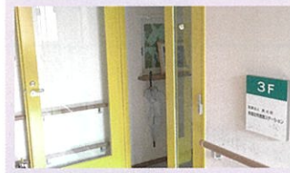
熱海訪問看護ステーション