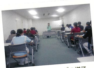
オリエンテーリングの様子

今年度は看護師試験・准看護師 試験に、この春合格した6名を含め 16名が顔を合わせ、上司や先輩からの説明に熱心に耳を 傾けていました。