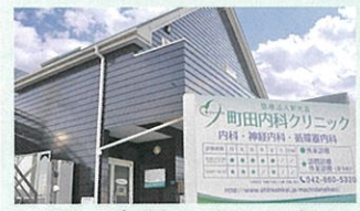
町田内科クリニック